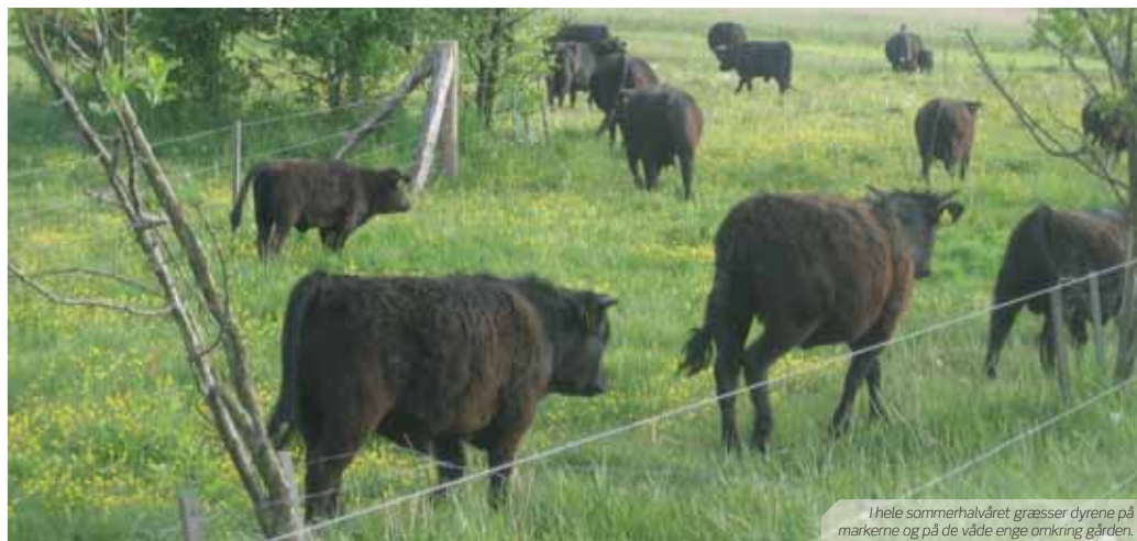
I hele sommerhalvåret græsser dyrene på markerne og på de våde enge omkring gården.