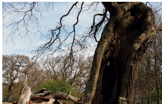
Stående gamle træer kan udvikle hulheder. Hullerne kan indtages af nogle arter af vilde bier, men kan også være hjemsted for fugle og flagermus.