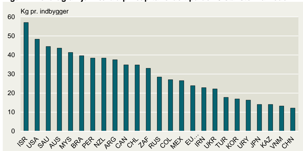
Figur 2: Forbrug af fjerkrækød pr. capita fordelt på de 25 største markeder