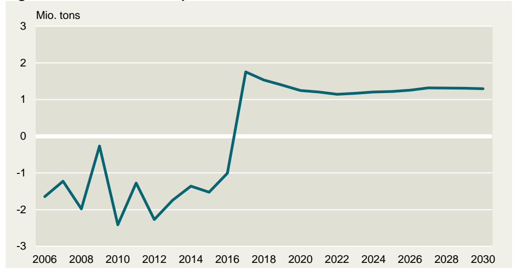
Figur 2: Forventet nettoeksport af sukker i EU