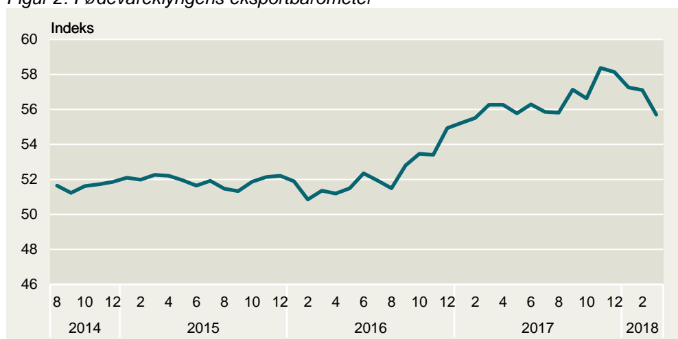
Figur 2: Fødevareklyngens eksportbarometer

Anm.: Indikatoren er baseret på PMI-indekset, vægtet efter fødevareklyngens 20 største eksportmarkeder. Udviklingen i barometeret afspejler dermed den generelt voksende efterspørgsel, der driver opsvinget nationalt og globalt på fødevareklyngens vigtigste eksportmarkeder. Indekset signalerer vækst, når det er over 50, og faldende eksport, når det er under 50.