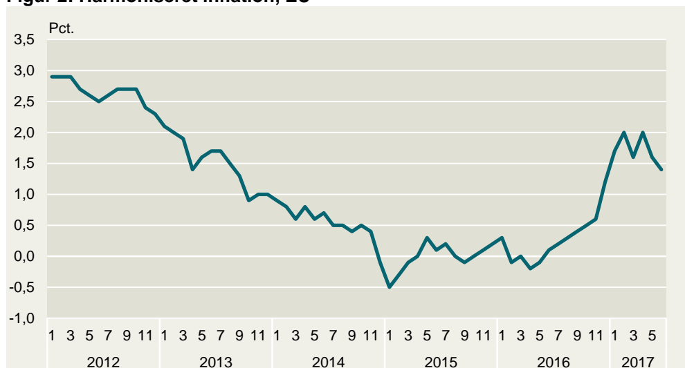
Figur 2: Harmoniseret inflation, EU

Kilde: Landbrug & Fødevarer pba. Eurostat.