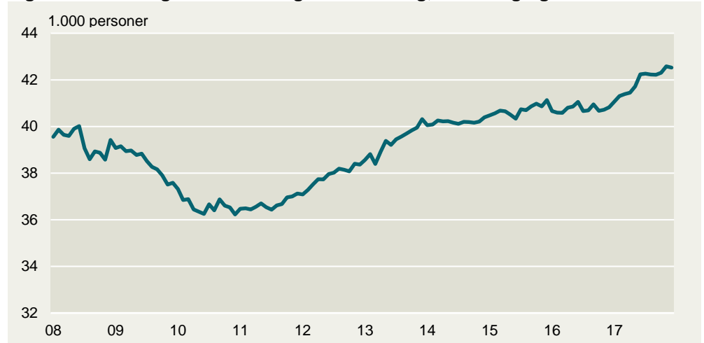
Figur 3: Beskæftigede lønmodtagere i landbrug, skovbrug og fiskeri