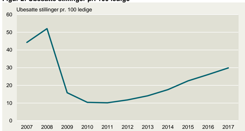
Figur 2: Ubesatte stillinger pr. 100 ledige